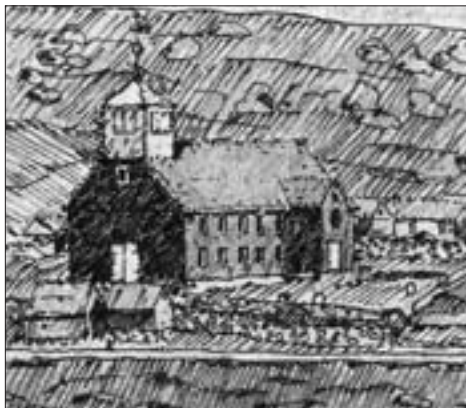
Núverandi Havnar kirkja er bygd í 1788. Legg til merkis, at vindeyguni eru í tveimum hæddum, og at kirkjan upprunaliga hevði flagtak.

Í 1865 verður Havnar kirkja frá 1788 heildarumbygd og hesa uppgávu fer hann eisini undir, hóast hon er sera torfør.