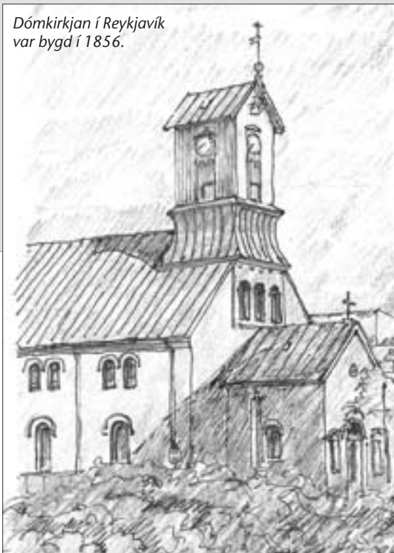
Kirkjan á Kirkjukletti í Vági varð vígd í 1862. Tornið er meinlíkt dómkirkjuni í Reykjavík.