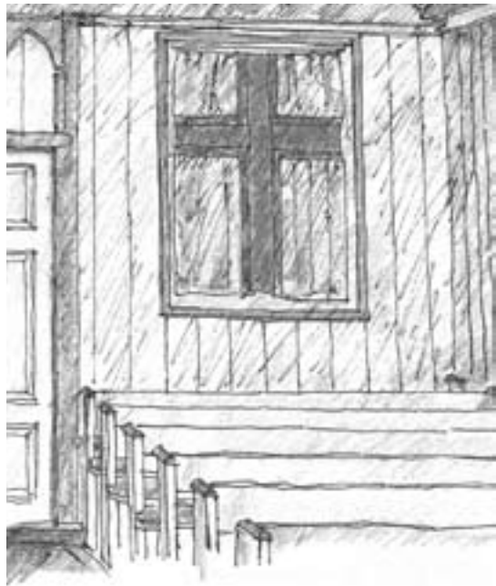
Fyrsta Merkið er at síggja í kirkjuni í Fámjin

Nýggja kirkjan í Fámjin er á mangan hátt meirlík Ólavskirkjuni í Kirkjubø, sum varð bygd í 1874.