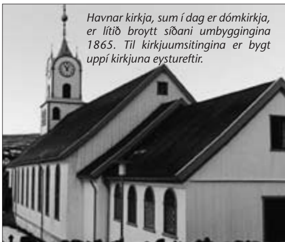
Havnar kirkja, sum í dag er dómkirkja, er lítið broytt síðani umbyggingina 1865. Til kirkjuumsitingina er bygt uppí kirkjuna eystureftir.

Fyrmyndin til hesi puntutu hválv, bæði í Íslandi og Føroyum, er uttan iva stóra hválvíð í dómkirkjunum í Keypmannahavn. Hetta hválv er múrað í ferhyrntum kasettum, sum puntarnir í okkara kirkjum er eftirgerð av.