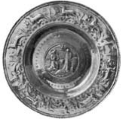
Dópsstatið, ið er tíðarfest til 1601. Í dag er tað í dómkirkjuni, og er kanska tað elsta vit eiga.

Havnar kirkja hevur tá kunna rúmað eini 150 fólkum og var um hetta mundi nógv tann størsta kirkjan í landinum og