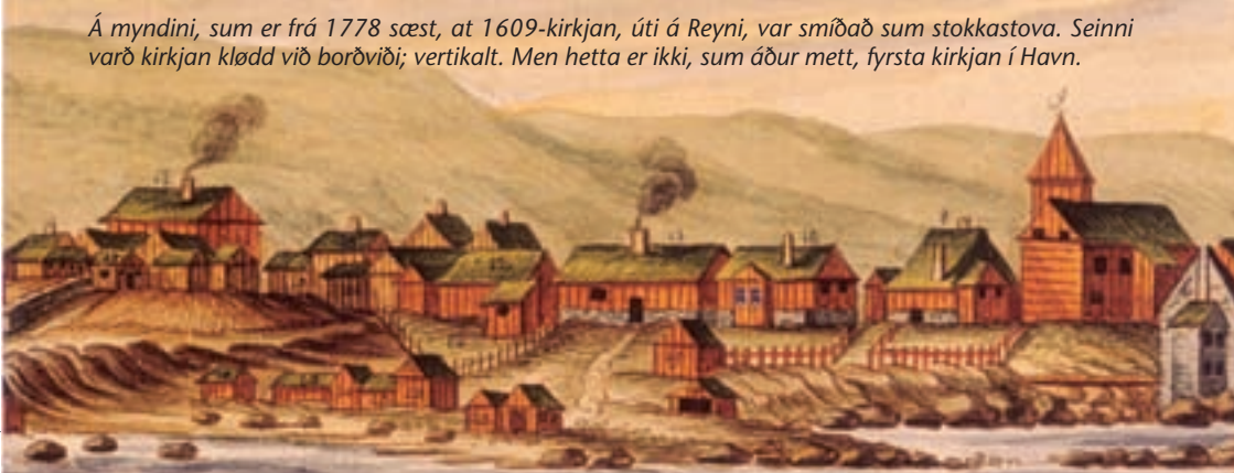
Á myndini, sum er frá 1778 sæst, at 1609-kirkjan, úti á Reyni, var smíðað sum stokkastova. Seinni varð kirkjan klødd við borðviði; vertikalt. Men hetta er ikki, sum áður mett, fyrsta kirkjan í Havn.

Talvan, sum ikki er til longur, skal hava verið úr svartmálaðum eikiviði og áskrivað við gyltum bókstøvum. Tekstururin var hesin: „ANNO 1609 LODT