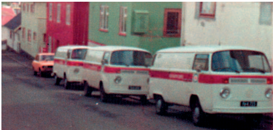
Bjarnvarður hevði eitt skifti tríggjar vørubilar, sum vóru gjördir út til oljufýrtænastu

Tað merkir ikki, at sjálvt arbeiði altíð kravdi so nógv. Í ávísam førum var orsökkin til trupulleikan hjá kundanum t.d. at ongin olja var eftir í oljutanganum. Tá var lætt at loysa trupulleikan. Hinvegin kom tað t.d. fyri, at