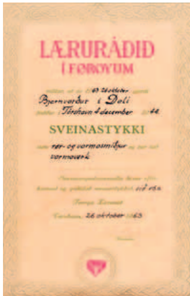
Sveinabrævið er dagfest 26. oktober 1963

Í lýsing í bløðunum boðaði hann frá, at hann var byrjaður við hesi nýggju tænastruni. Í tí lág, at fólk, sum finga trupulleikar við miðstovuhitu kundu boða honum frá umvegis