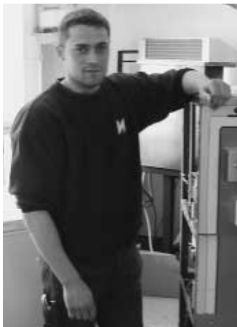
Á verkstaðnum, har hvítvørur og el-lutir verða umvald.

Um eg skal provokera eitt sindur, so vil eg siga, at hetta nokk er mest galdandi fyri tey, ið koma av teimum størru plássunum, sum til dømis úr Havnini.