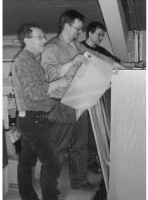
Arkivið við teimum mongu el-tekningunum hjá L.M.-Electric.

Á sama hátt eru tað hesir lærlingar, sum skulu føra arvin og tær handverksligu dygdinar víðari til komandi ættarlið av handverkarum, og tí eru teir á sama hátt samfelagsligani sæð ein treyt fyri framtíð og framburði í okkara landi.