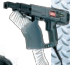
DURASPIN DS275 AC inkl. 12000 stk 39A35mp