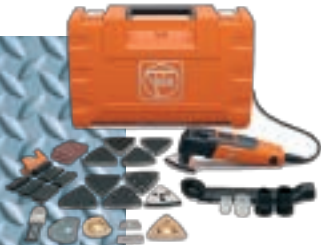
MULTI MASTER TOP