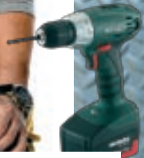
METABO AKKU BS 18V LI 2 x battarí (2,2ah lithium)