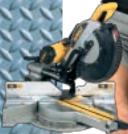
DEWALT KAP OG GERINGSSAG DW718