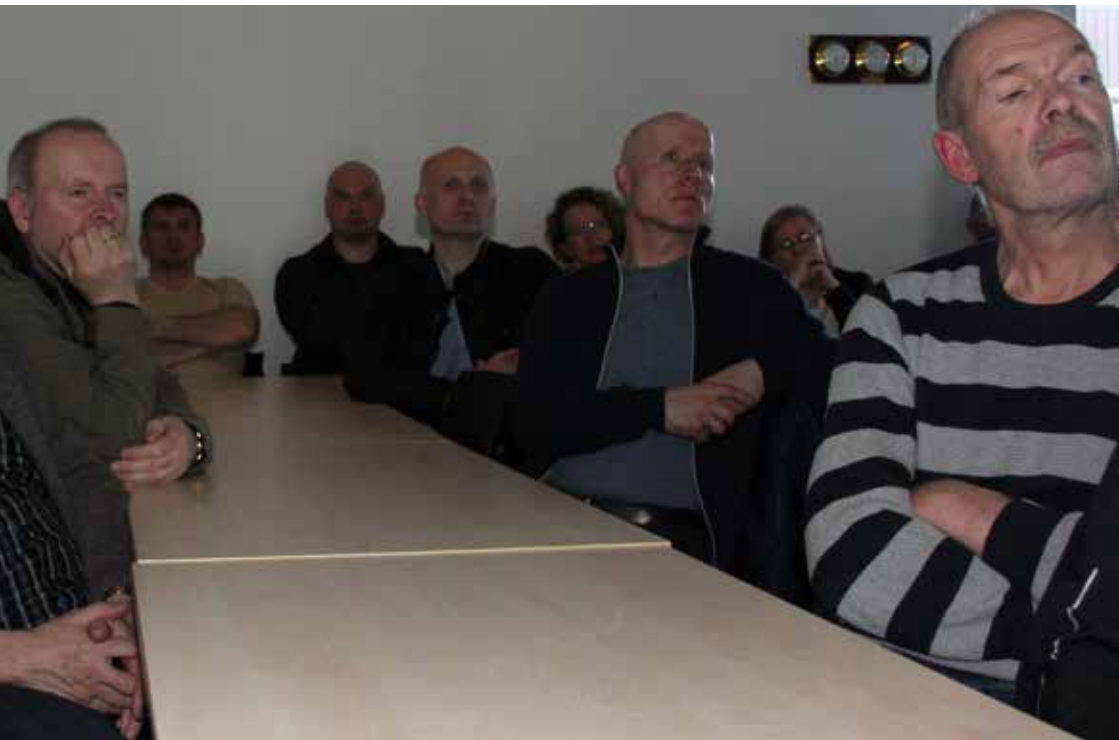
Fundarluttakarar á aðalfundi felagsins 26. mars 2014.05.14.

royna Trygdargrunnin, men ekki øll krøv verða góðkend. Tað ringasta ein kann gera, um arbeiðsgevarin ikki rindar tað hann skal, er at halda seg passivan. Kemur eitt krav til dómstólin um t.d. manglandi eftirløn, og handverkari ikki leypandi hevur gjørt vart við hetta hjá arbeiðsgevaranum, verður eitt slíkt krav, sum oftast avvíst. Tí er tað sera umráðandi at gera vart við seg, tá slíkt hendur. Eitt sum er minst líka umráðandi er, at handverkarin krevur av arbeiðsgevaranum, at fáa lønar-