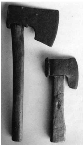
Øksir, tann störra at grovhægga við og tann minna til skoytir, at hægga innanúr og at halda fyrri við, tá ið klinkað varð.