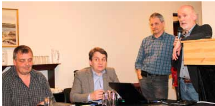
Mynd frá eykaðalfundinum

Á ársaðalfundinum í Eftirlønargrunninum í mars mánað í ár varð umrøtt, um onnur enn tey, sum eru limir í handverkarafeløgum, kunnu gerast limir í grunninum. Skal hettar lata seg gera, mugu viðtøkurnar broytast. Tey sum møtt vórðu á aðalfundinum, góðu til kennar, at áhugi avgjørt var fyri hesum, og at nevndin í grunninum átti at arbeiða víðari við einum slíkum málið.