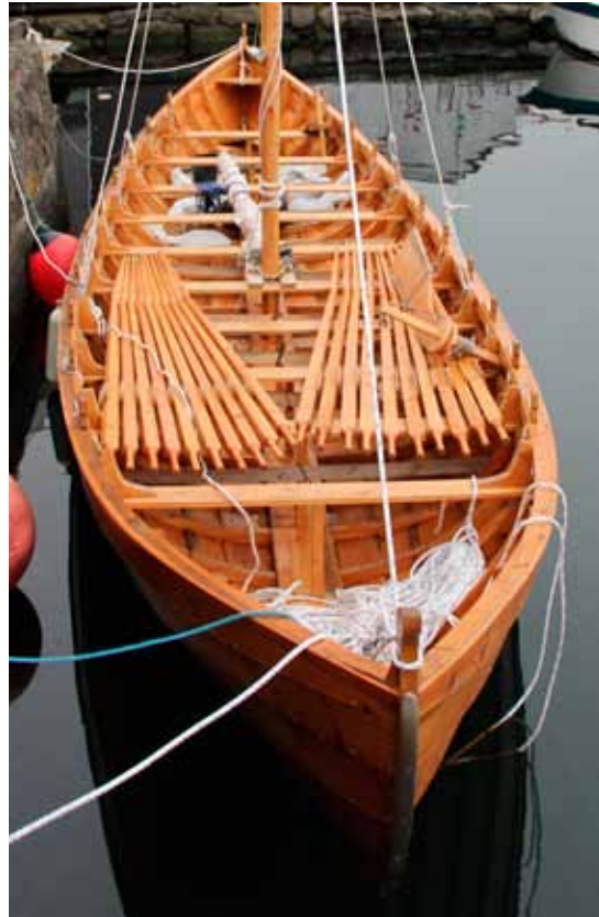
Kaj metur, at var báturin 125cm longri, so hevði hann komi betur til sín rætt.

Harumframt vóru á hann avmerkt nøkur týðandi fóst mát, eitt nú, hvussu nógv ein bátur av ávísari stødd skuldi vera reistur, hvussu langt eitt rúm skuldi vera, viðhvørt