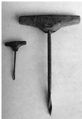
Tvári og Navári