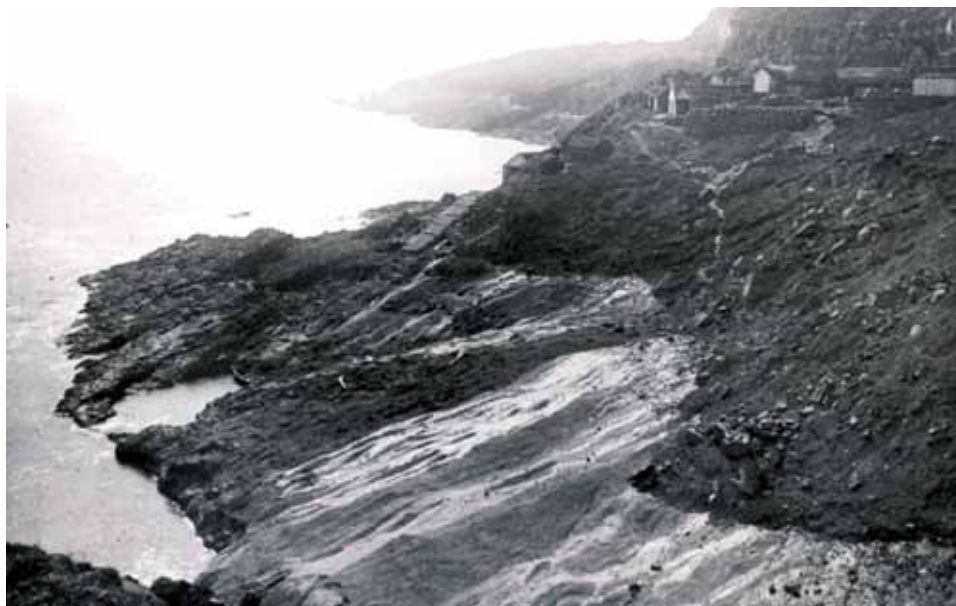
Lendingin í Mykinesi seinast í 19. öld.