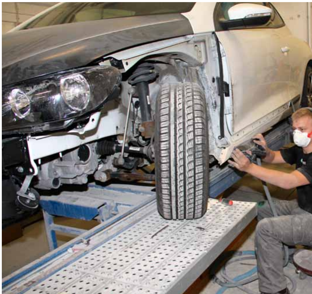
Jogvan Isaksen í full sving

men eg hevði ikki rokna við at eg fór at fáa 1. plássið.