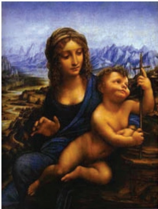
Málningur eftir Leonardo da Vinci.

Um hesa tíðina høvdu listafólk góðar umstøður í Italia. Tey sum sótu við valdinum í landinum høvdu tokka til list og veittu listafólki dyggan stuðul.