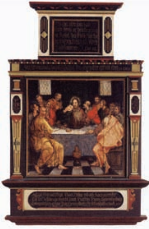
Eldra altartalvan, sum nú hongur á norðursíðuni.

befundet sig í Thorshavn siden 1829, for defintivt”.