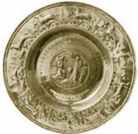
Skýmarfatíð frá 1601 er ein tann elsti kirkjuluturin í Føroyum.

Umbyggingarbeiðið byrjar tíðliga á sumri