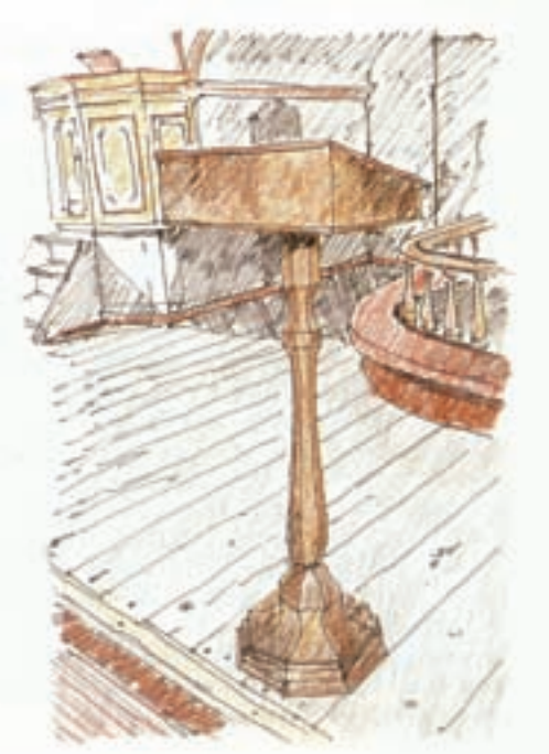
Lestrarpulturin er úr mahogni, frá 1866

Hann skrásetur eisini gávor frá sær sjálvum, gipstalvu við mynd: Jesus signar tey smáu bønnini. Rætt er óivað eisini, at krossurin er komin úr Havn, sum frásøgur vita at siga, men hann er tó ikki krossurin, ið hoyrði til 1830-rammuna.