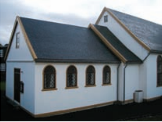
Altartalvan stendur í tí litla útbygninginum. Tann longri við 4 vindeygum er bygdur seinni, og er skrivstova.