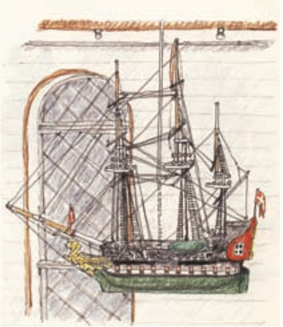
Modell av "Norsku Løvu", sum först á Lambavík 1707.

Um rammuna, sum er um altartalvuna sigur Sverri: Ramman stendur á gólvinum hvørjumegin altarið og røkkur heilt upp undir loftið í innvikinum. Hon er evnað úr samannegldum furufjalum, tí opin innan, brúnmálað uttan. Vangarnir eru í 5 ymiskum breiðum þørtum, tann niðasti 52 cm., næstniðasti 41 cm. og hinir 30. cm breiðir. Teir eru í erva bundnir saman við o.u. 50 cm breiðum tvørbita, men í neðra bara við mjáari karmfjøl undir myndini.