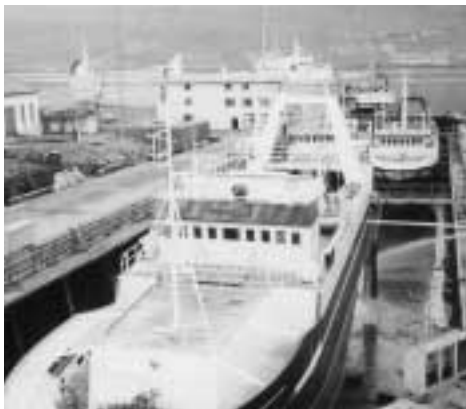
Mynd tikin niður í dokkina í 1995. Fremst Vesturvarði; aftanfyri, lið um lið, tveir kubatrolarar.