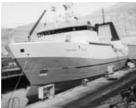
Ocean Castle í dokk (bygginummar 53; latið í 1989). Skipið hefur havt ymiskar eigarar og ymisk növn, t.d. Napoleon, nú eitur skipið Fríborg.

Tá setti felagið 100.000,- kr. í P/F Vál, sum keypti og umbygdi Leiv Hepna; hann fekk tá navnið Skálafossur. Í 1977 seldi P/F Vál skipið, sum tá fekk navnið Havlot. Her kann leggjast afturat, at limagjaldið hækkaði til 4% fyri at gjalda lánið fyri Skálafoss, og 100.000,- kr. vóru nógvir pengar í 1970.