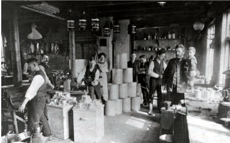
Verkstaðið í Tórsgøtu í 1915