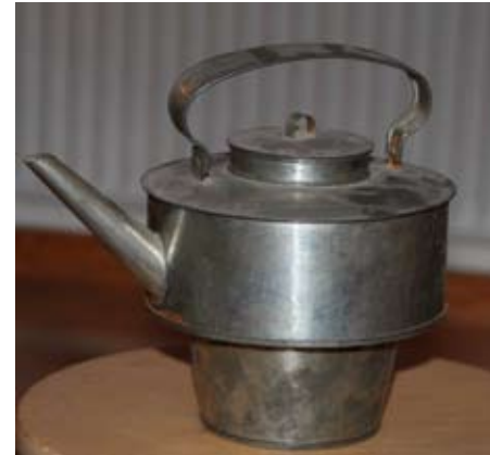
Ein partur av sveinastykkinum, ketil úr blikk.