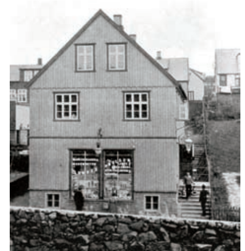
Gamli handilin hevði "útstílningsvíndeygu" út ímóti Tórsgøtu.