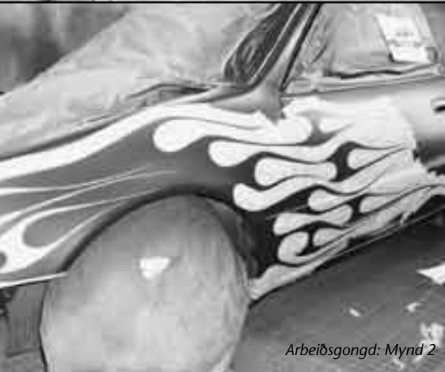
Arbeiðsgongd: Mynd 2