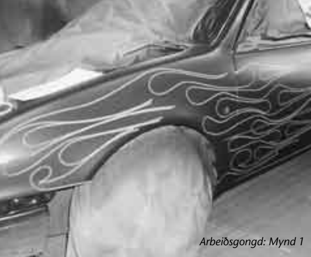
Arbeiðsgongd: Mynd 1