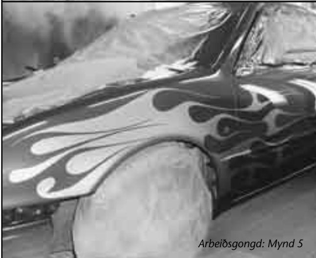
Arbeðsgongd: Mynd 5