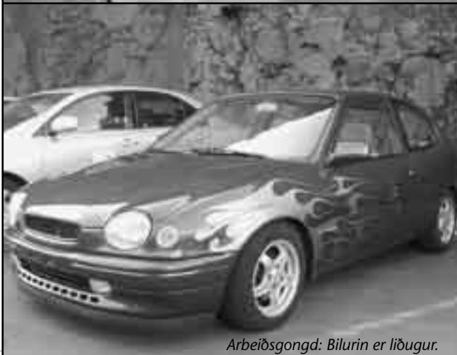
Arbeðsgongd: Bilurin er liðugur.