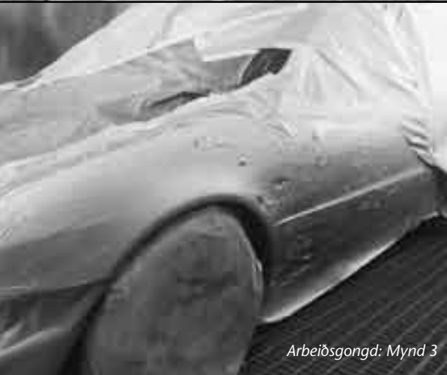
Arbeiðsgongd: Mynd 3