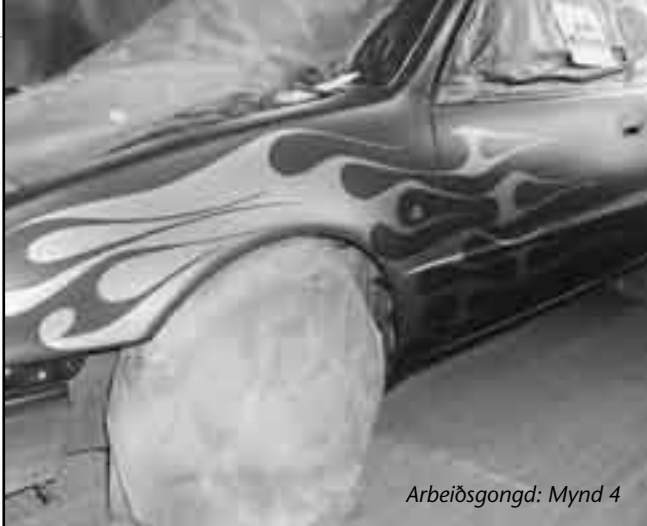
Arbeðsgongd: Mynd 4