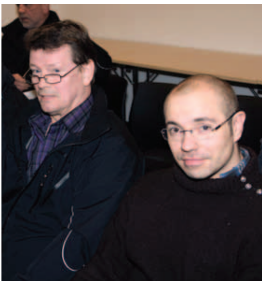
Mynd frá aðalfundi Hanvar Handverkarafelags

Føroyar hava brúk fyri nýggjum politikki, og tí eiga teir flokkar, ið nú sita í andstøðu at fáa valdið. Tað er onki at ivast í, at teir eru fýrir fyri at fáa skútuna á rættkjøl aftur.