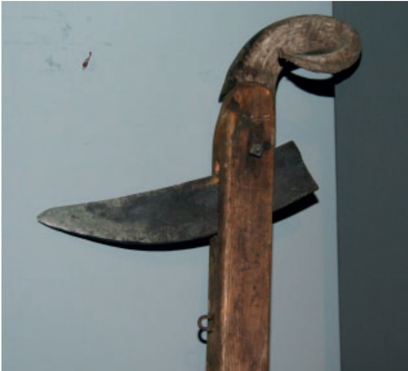
Ein ristari, ið varð nýttur í sambandi við torvskurð. Eitt veðurlambshorn er fest í endan.

horninum. Hetta var nýtt í staðin fyri fløskuna.