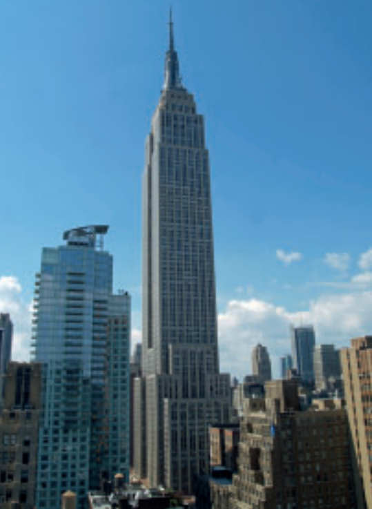
Empire State Building í New York.

handilin, og við forsetanum Teddy Roosevelt var við góðum hugi farið undir arbeiði at knýta saman Atlantshavið og Kyrrahavið.