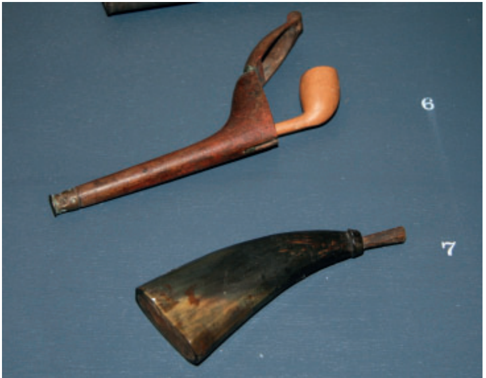
Pípa við pípuhúsa og eitt snúshorn úr horni.