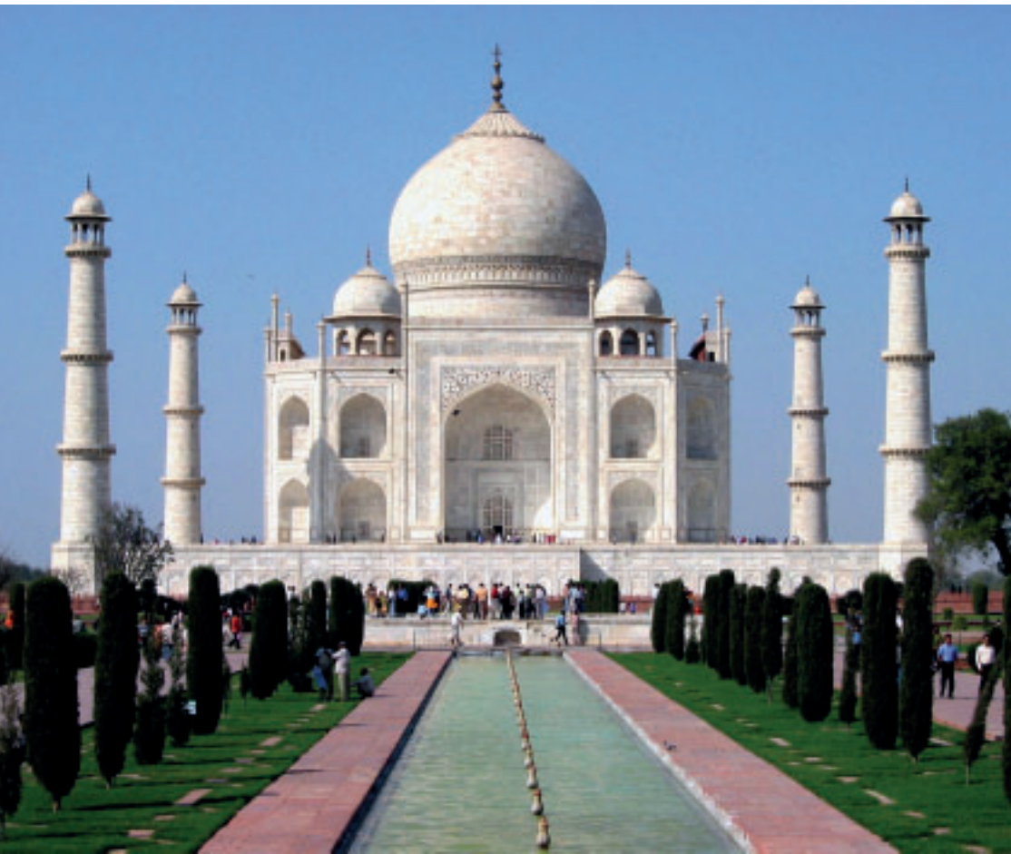
Taj Mahal, soleiðis sum tað oftast er avmyndað.

Tann fyrsti at gera ein lista við sjeý bygningsverkum, sum hann nevndi “Heimsins sjeý undurverk” var grikkinn Antipater úr Sidon, sum livdi u.l. ár 150 f. kr. Hann ferðaðist víða um í tí - tá kenda heiminum - og skrivaði drúgvur frásagnir um sínar ferðir. Tað er út frá tí, sum hann sá og hoyrði um, at hann ger sín lista við 7 bygningsverkum, sum hann metti vóru tey