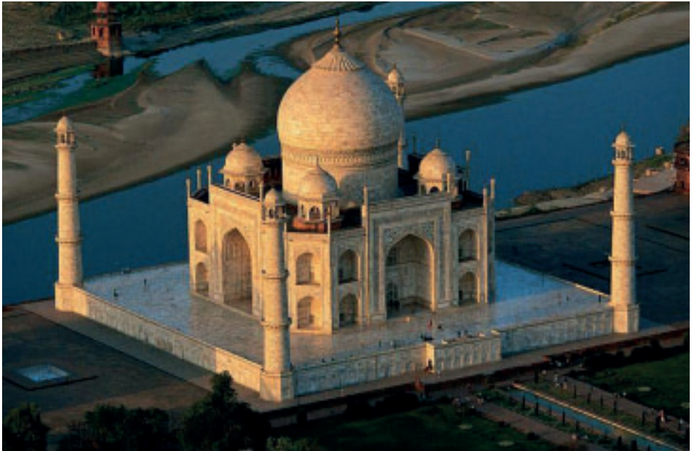
Taj Mahal, í sínum umhvörvi.

Fyrsta undurverkið á listanum hjá Antipater er “Halikarnassos Gravtemplið” (u.l. ár 356 f.Kr.). Nr. 2: “Artemistemplið í Efesos” (u.l. ár 550 f.Kr.). Nr. 3: “Hangandi havarnir í Babylon” (u.l. ár 600 f.Kr.) Nr. 4: “Zeus standmyndin í Olympia” (u.l. ár 450 f.Kr.). Nr. 5: “Kolossurin á Rhodos” (u.l. ár 305 f.Kr.) Nr. 6: “Vitaverkið við Aleksandria”, og at enda “Keopspyramidan í Egyptalandi” (u.l. ár 400 f.Kr.).