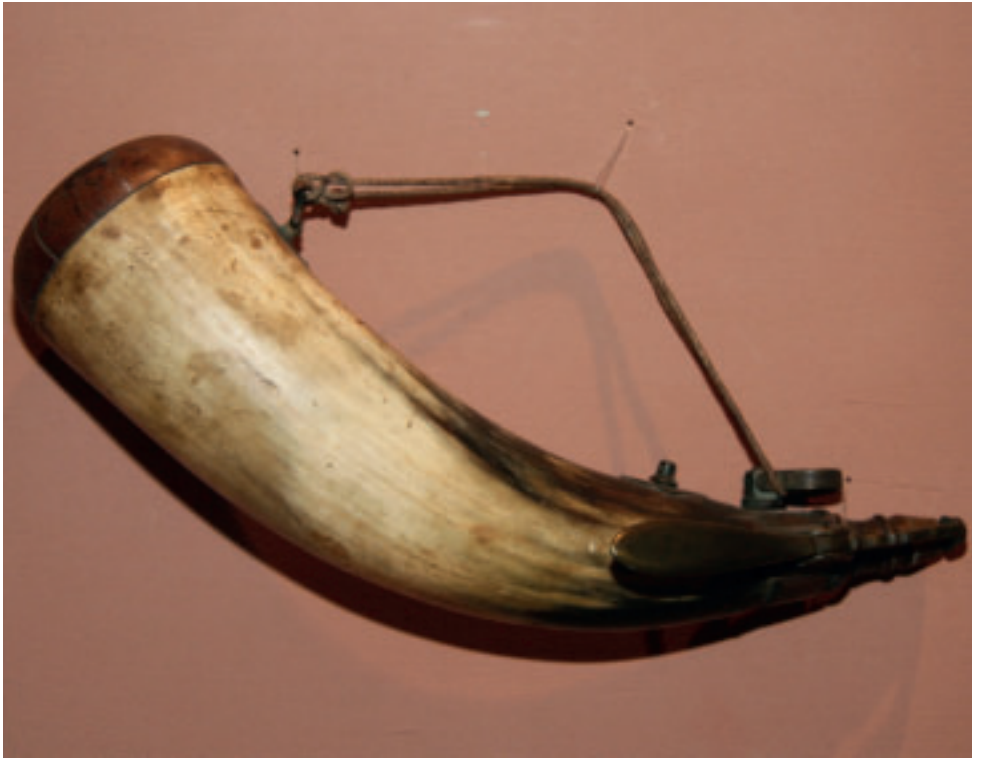
Krúthorn úr horni.

breiðara endan verður gjört eitt avlangt hol, og á hin endan verður gjört ein tappur, sum gongur ígjøgnum holið. Á tappinum er eitt móthak, soleiðis at tappurin sleppur ikki út aftur, tá ið hann er fallin í holið.