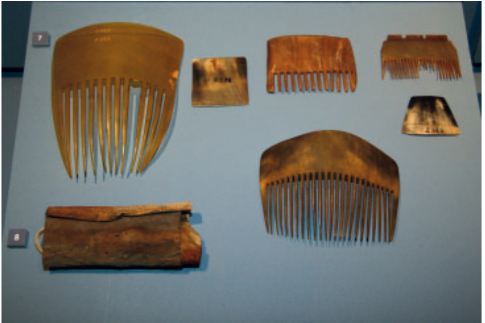
Kambar úr horni.

forming, heldur það skapið, það hefur fingið, meðan það var heitt.