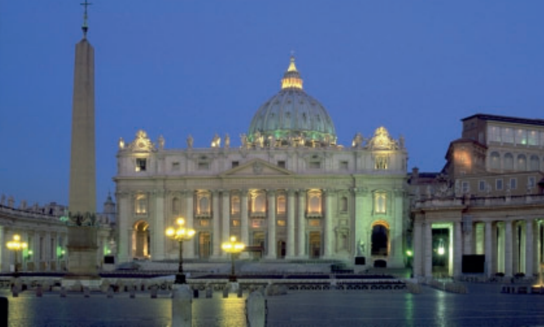
Pæturskirkjan í Róm..

Konstantin keisara. Henda kirkjan stóð uppi í 1200 ár, tá var hon so mikið illa farin, at Julius annar pávi gjörði av at taka hana niður og byggja eina nýggja á sama staði.