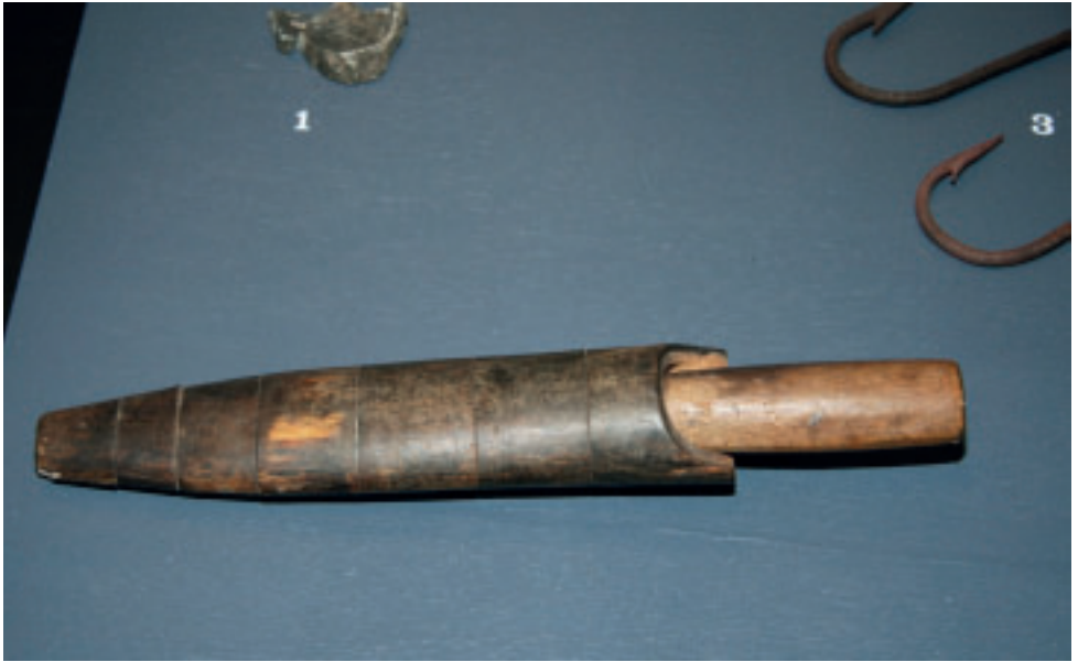
Slíðrin, ið er lagdur við horni.