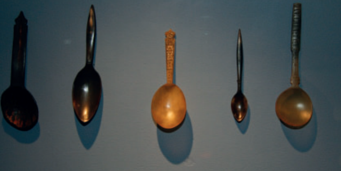
Sþonir úr horni.

slíkt skóhorn var sjálvandi at finna í hvørjum húsi, tá ið svartaskógvar vóru komnir í nýtslu.