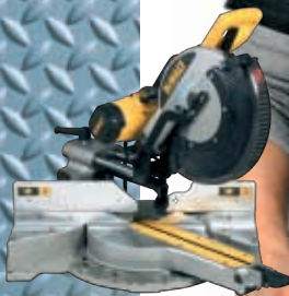
DEWALT KAP OG GERINGSSAG DW718