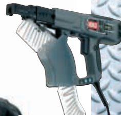
DURASPIN DS275 AC inkl. 12000 stk 39A35mp