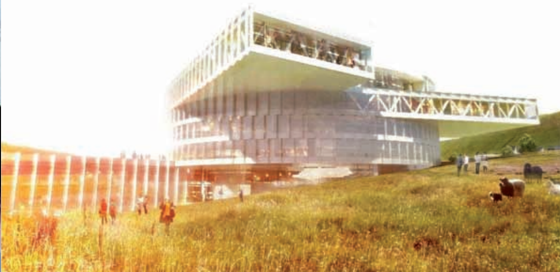
Modell av skúladeplinum í Marknagili, sett inn í umhvervið á staðnum.

landslagið, við tess líðum og flötum, er íblásturinn til torgið, har trappur og flagar gerast karmur um sosialt og fagligt samskipti og tiltök. Her er möguleiki fyri at halda matarsteðgir, gera bókkkaarbeiði eins og at savnast í stóra auditoriinum. Torgið – alt sum tað er, er ein stór amphileikhøll tøk til stór sosial og faglig tiltök.