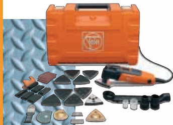
MULTI MASTER TOP