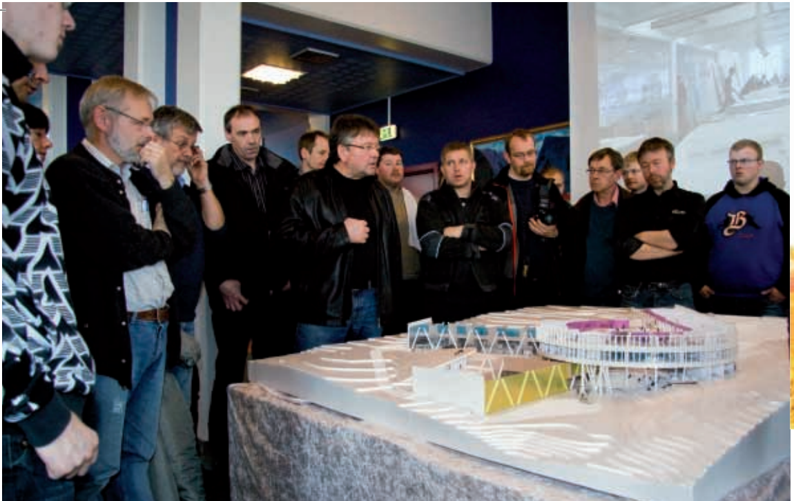
Heildarmynd av skúlanum, tá ið takið er tikið omanav.

FUGLARK og BIG saman við verkfrøðingafyrirtøkunum Sámal Johannesen, Martin E. Leo, KJ Elráð og Lemming & Eriksson, standa aftanfyrir uppskotið til Miðnámsdeplin við Marknagil. Stovnurin skal vera framtíðakarmurin um ungdómsútbúgvingarnar í høvuðsstaðarøkinum, og skal, sum hin størsta byggiverkætlanin í Føroya søgu, hýsa studenta- og HF-útbúgvingini, sum nú heldur til í Hoydølum, handverkslærlinga-, SIT-, HT-, byggitøkningaútbúgvingunum við Tekniska skúla í Havn og FHS- og HS-útbúgvingunum við Handilsskúlan við Marknagil.