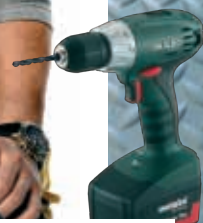
METABO AKKU BS 18V LI 2 x battari (2,2ah lithium)