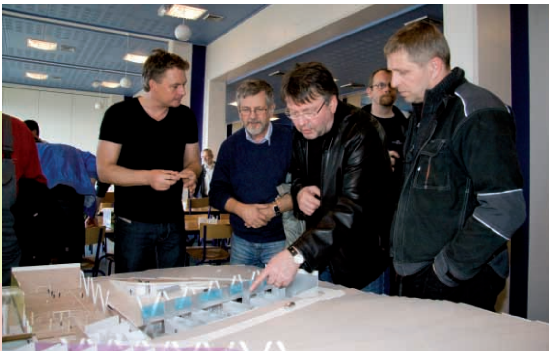
Høgrumegin verkstaðir til Tekniska Skúla. Vinstrumegin fimleikarhøll, sum er felagshøli, ið eisini er ætlað til stórar samkomur og fundir.

Skúladepilin í Marknagili verður væntandi 20.000 fermetrar. og sostatt størsta einstaka byggiverkætlan í Føroya søgu.